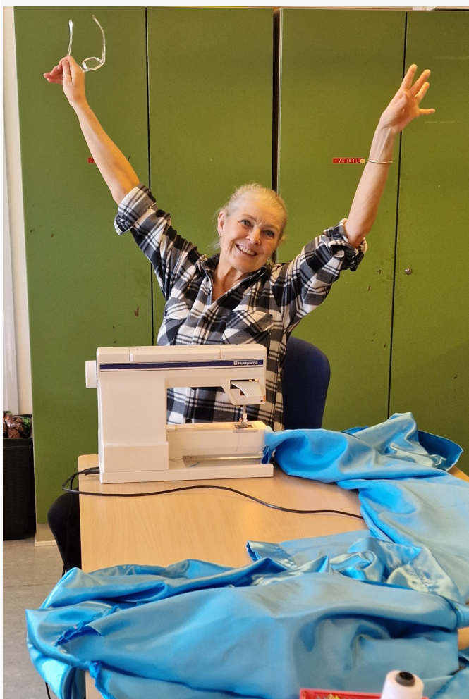
Sy-værksted: syning af kåber