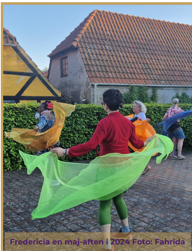
Fredericia en maj-aften i 2024