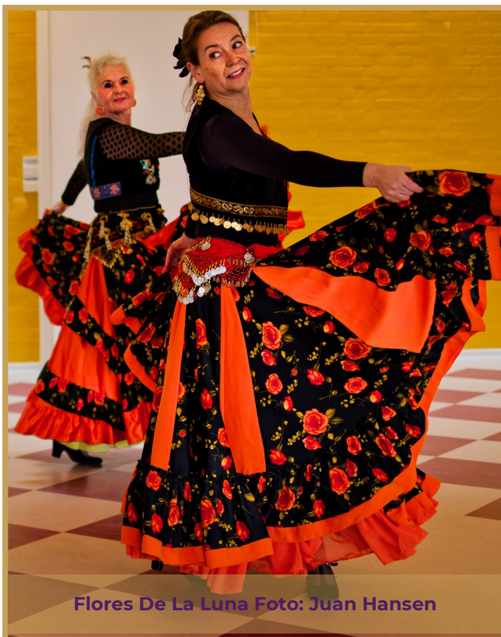
Flores De La Luna

Midt i denne brede palet af udtryk bidrog En- semble Amira med tre af deres koreografier: