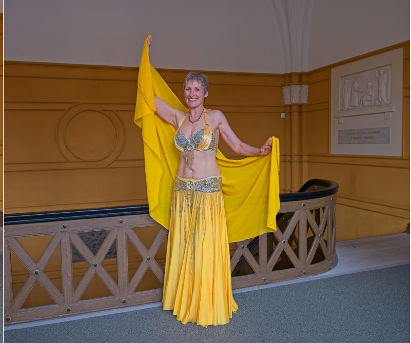
Billeder fra fotosession i Maldehls Rådhus 3. maj 2026