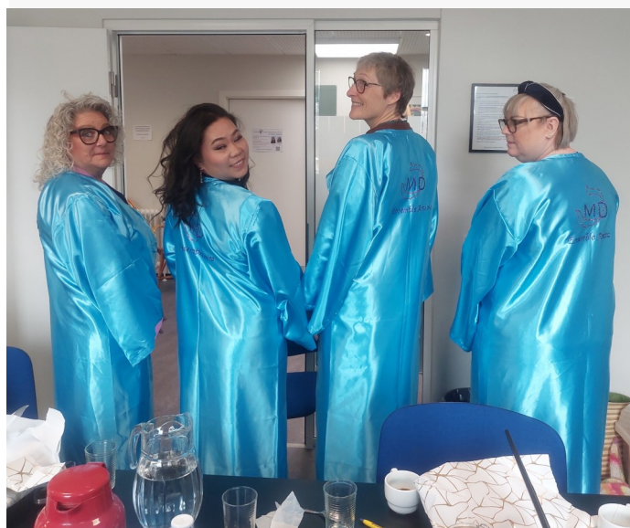
4 EA-piger med de nye kåber Til højre: jubilæumskagen og kåber til tørring

Med billederne fra fotosessionen og formandens beretning samlet her i bladet får vi mulighed for at genopleve dagen — og tage den med os ind i det kommende danseår.