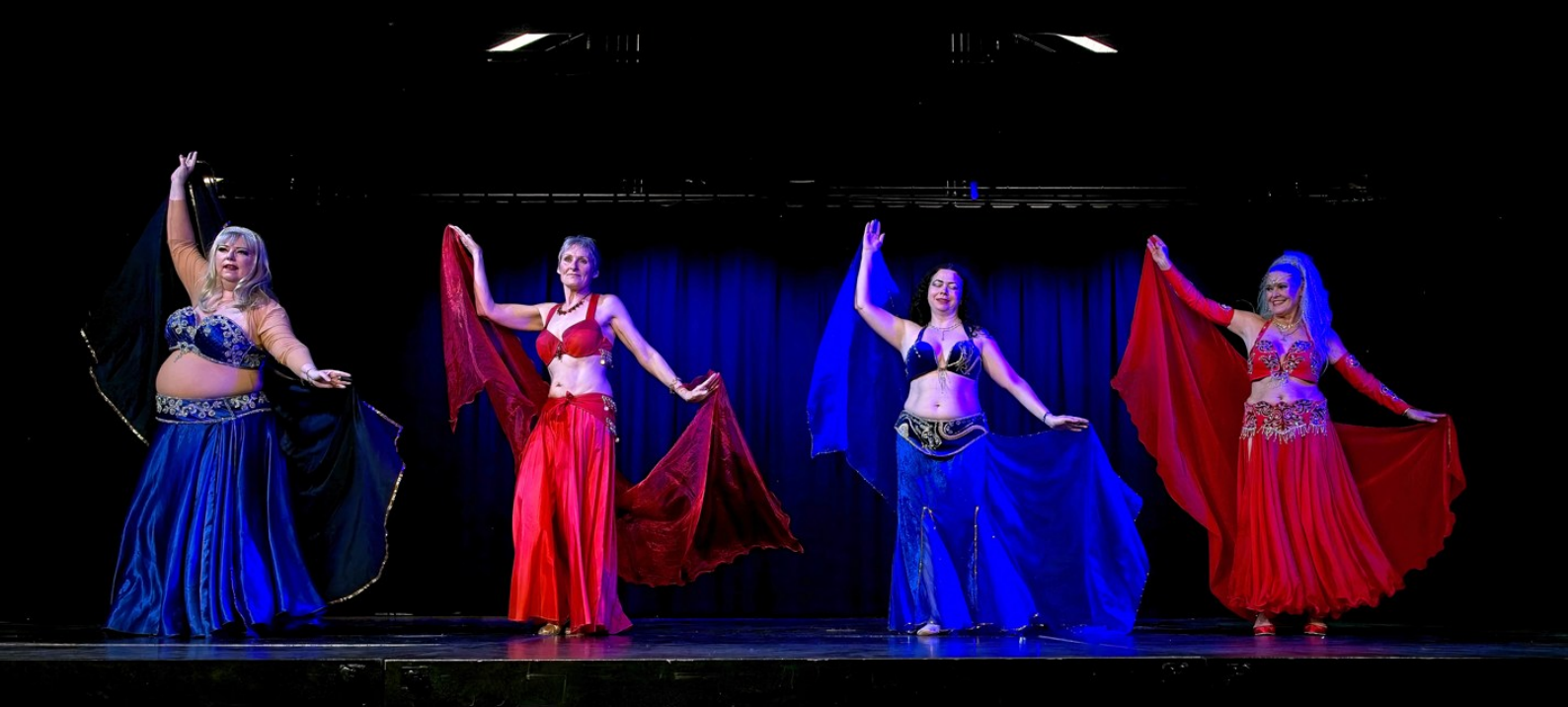
Billeder fra VMFs afdansningsbal 2026