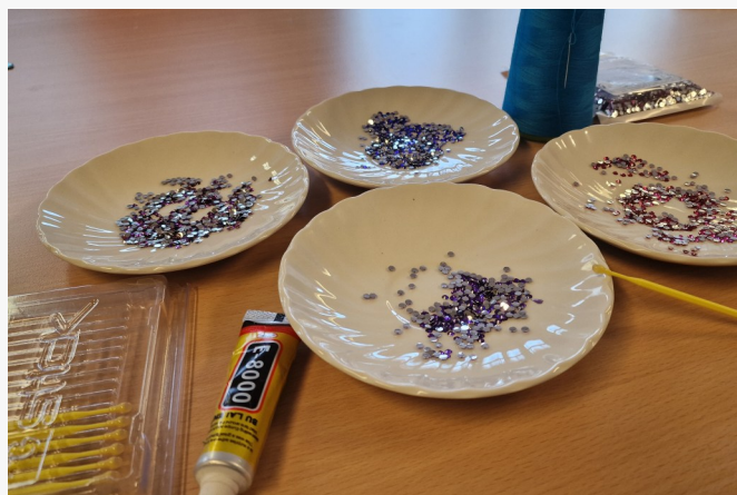
Der skal rhinsten på

I dette nummer viser vi et udvalg af billederne — øjeblikke, der indfanger både glæde og den særlige energi, der opstår, når vi står sammen som forening.