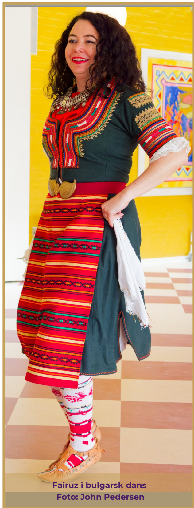
Fairuz i bulgarsk dans

Turnédage som disse handler om dans – men også om alt det, der sker imellem optrædenerne. I bilerne på vej frem og tilbage bliver der knyttet bånd og skabt venskaber på tværs af forskelligheder og kulturer. Det er her, vores fællesskab vokser, og hvor vi mærker, hvorfor vi gør det her sammen.