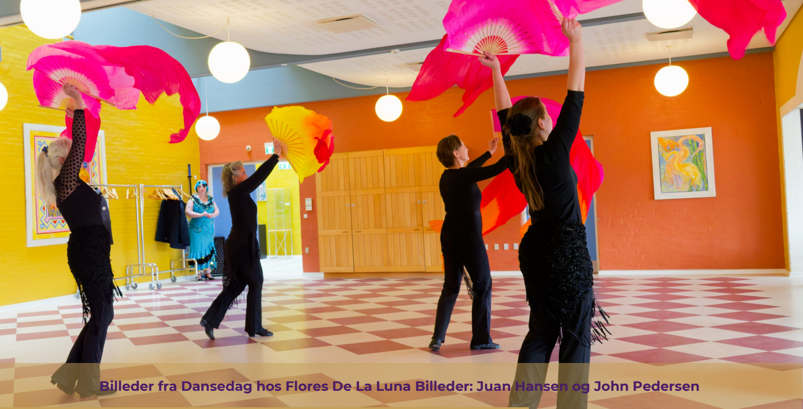
Billeder fra Dansedag hos Flores De La Luna