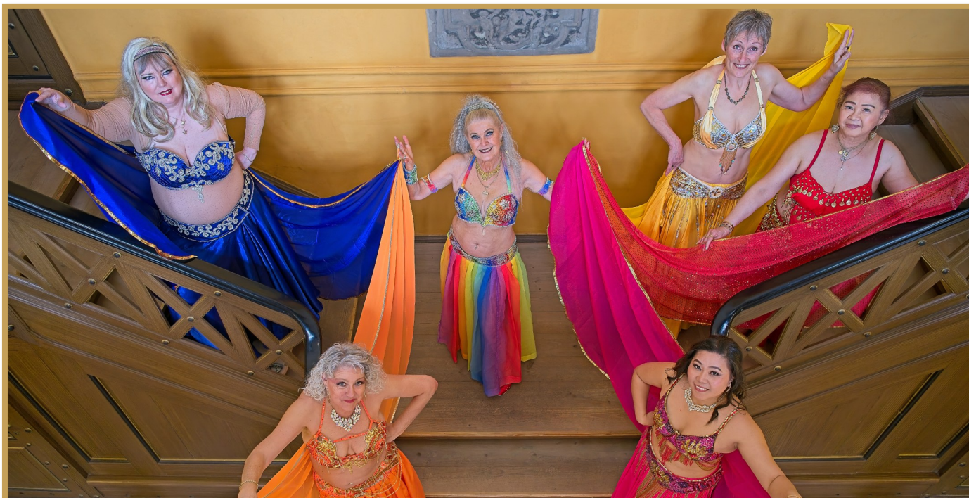
Fotosession 2026 på Meldahls Rådhus