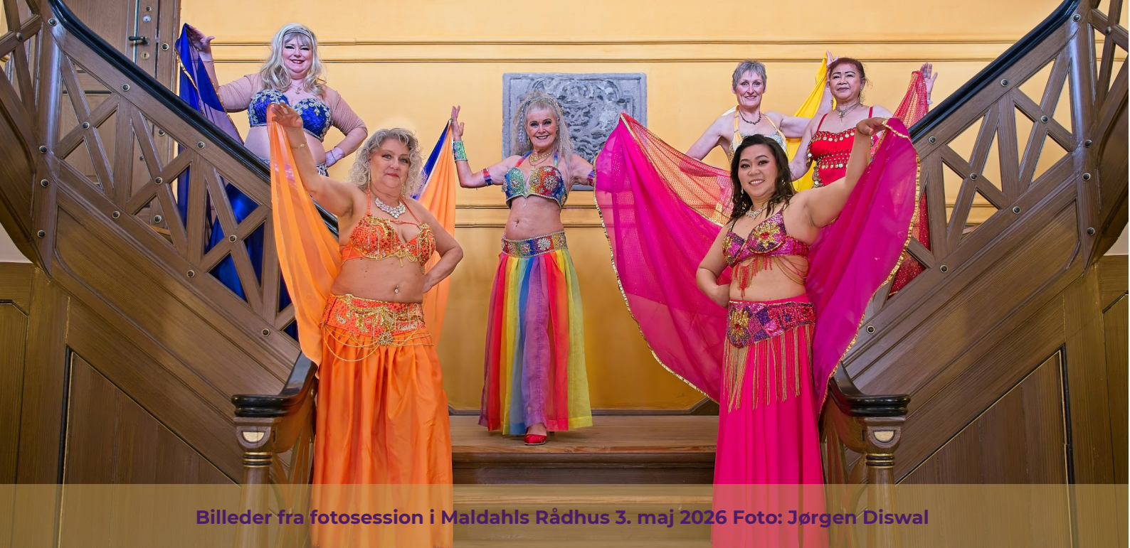
Billeder fra fotosession i Maldahls Rådhus 3. maj 2026