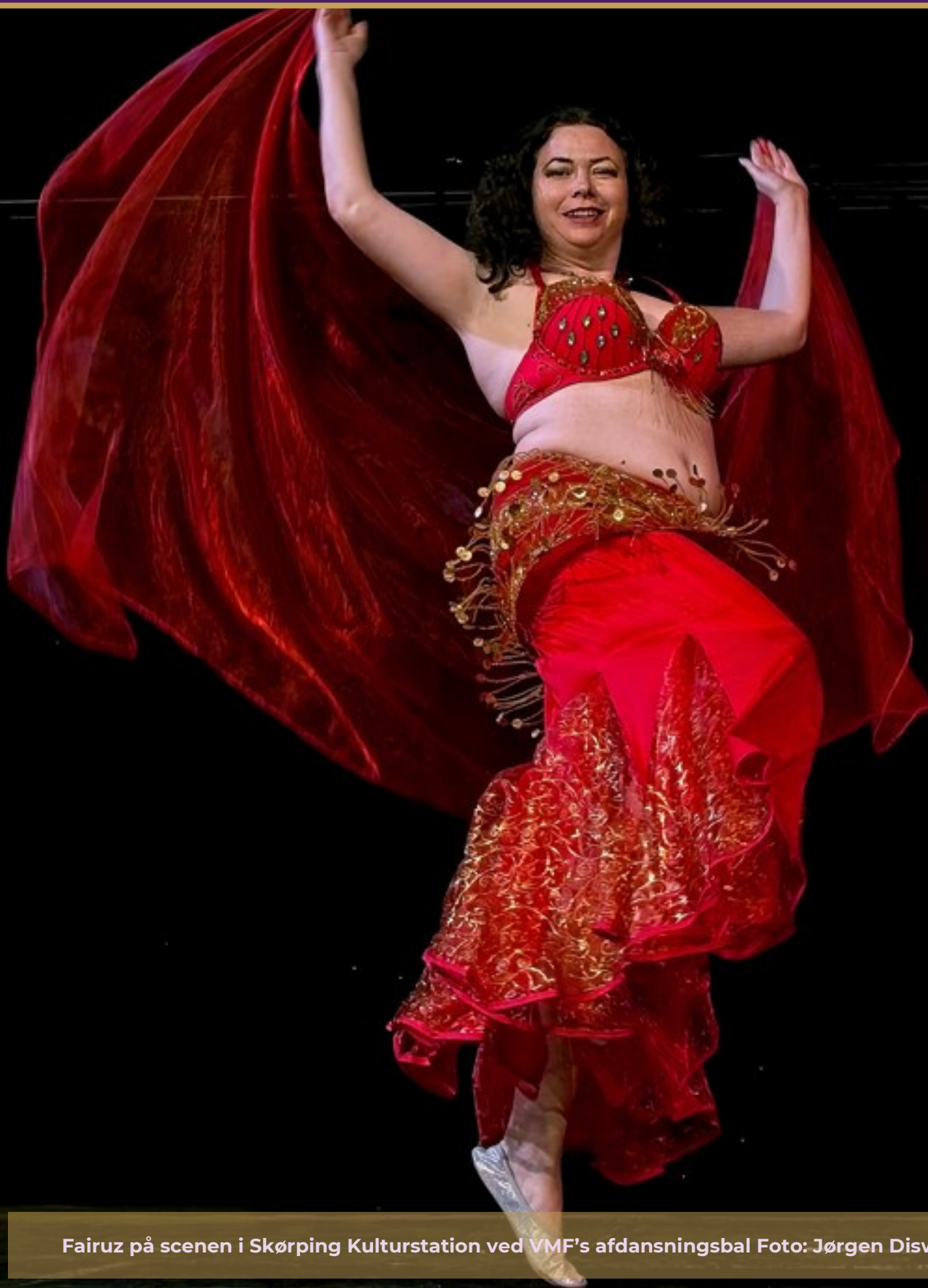
Fairuz på scenen i Skørping Kulturstation ved VMF's afdansningsbal